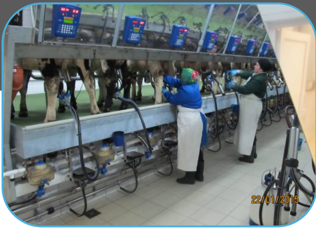
ovládací panely a měřiče nádoby