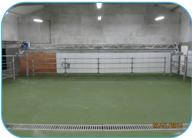
čekárna dojnic s příhaněčem