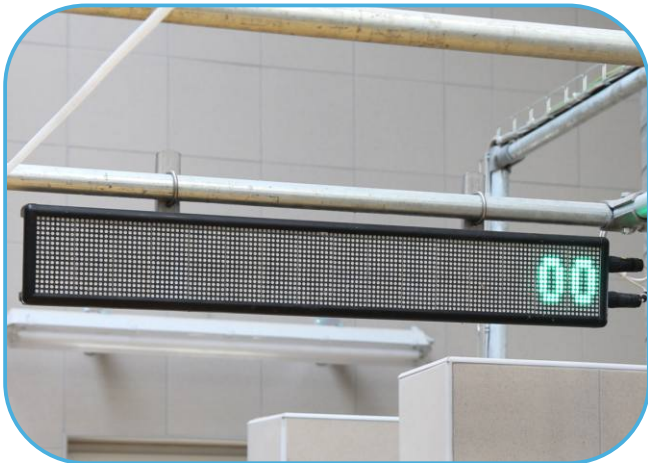
info panel je umístěn přímo na dojárně