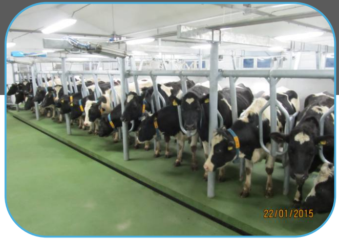
přítlak dojnic na dojárně