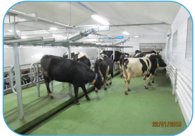
odchod dojnic z dojárny