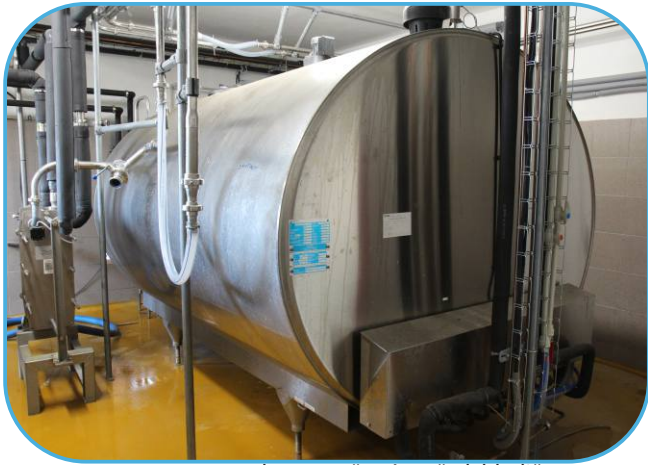
chladicí tank na mléko s dvoustupňovým předchladičem