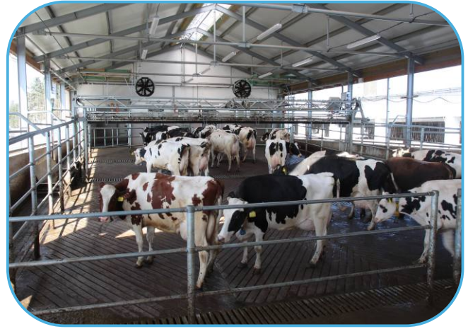
čekárna dojnic s přiháněčem se shrnováním kejdý