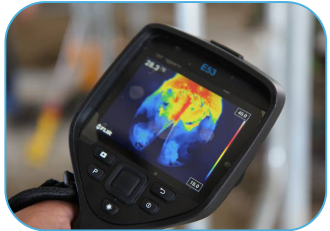
detail obrazu z termokamery