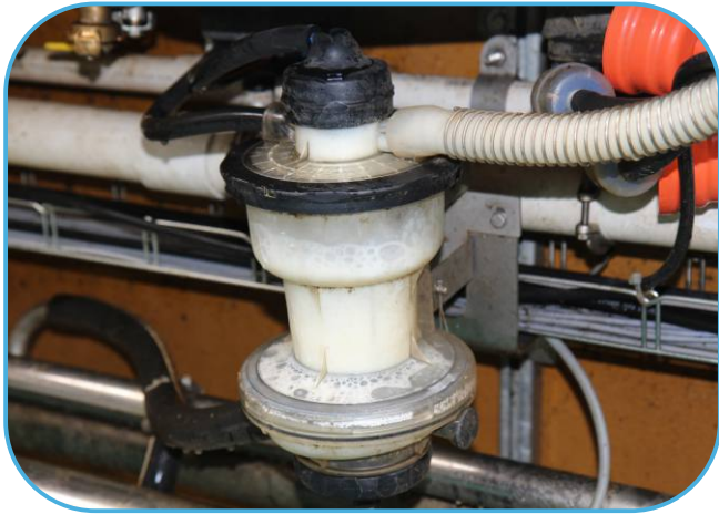
měřič nádoje IMilk 600