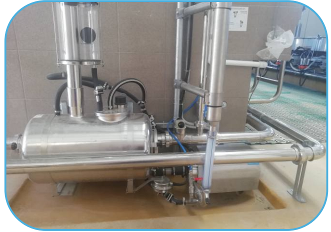
sběrná nádoba s čerpadlem