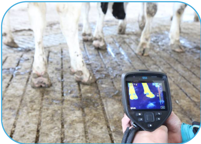
ruční systém pro detekci onemocnění končetin