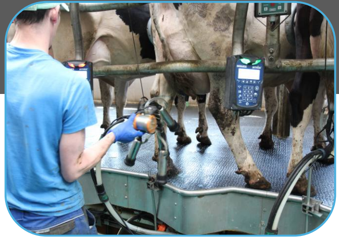
elektronika dojení a dojící stroj