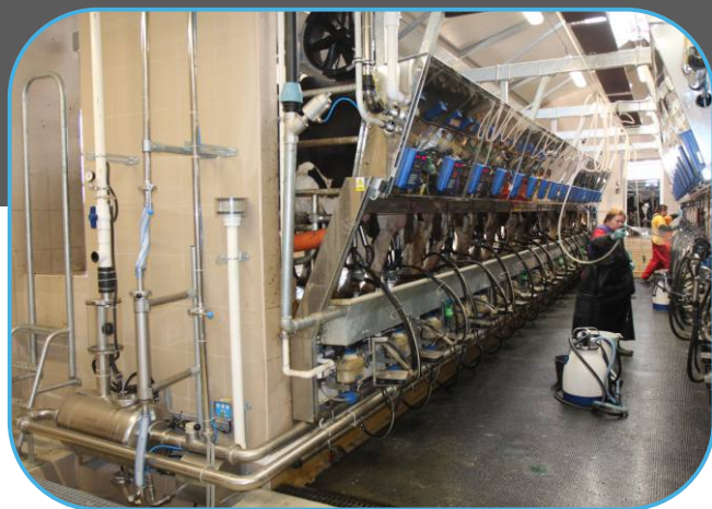
umístění čerpadla, sběrné nádoby a filtru