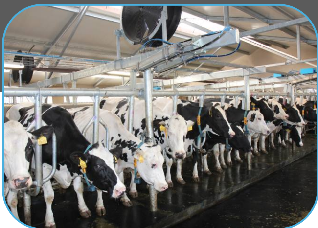
přítlak a rychlý odchod z dojírny