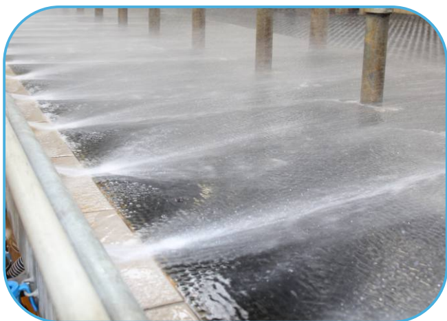
systém oplachu stání dojírny