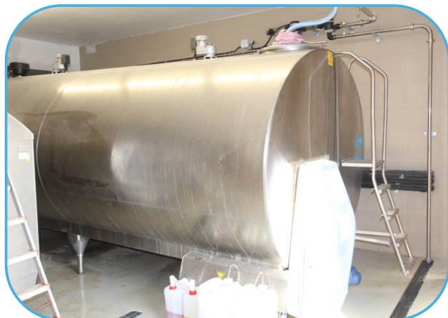
chladicí tank na mléko