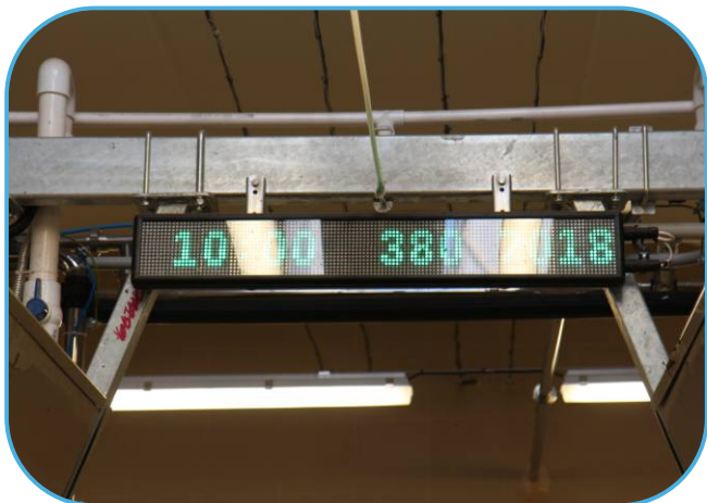
info panel je umístěný přímo na dojírně