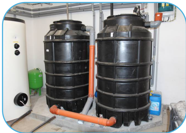
nádrže na odpadní vody z proplachu mléčného potrubí