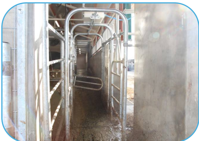
selekční branka na výstupu z dojírny