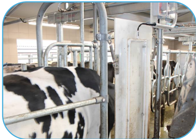
anténa identifikace dojnic na vstupu do dojírny