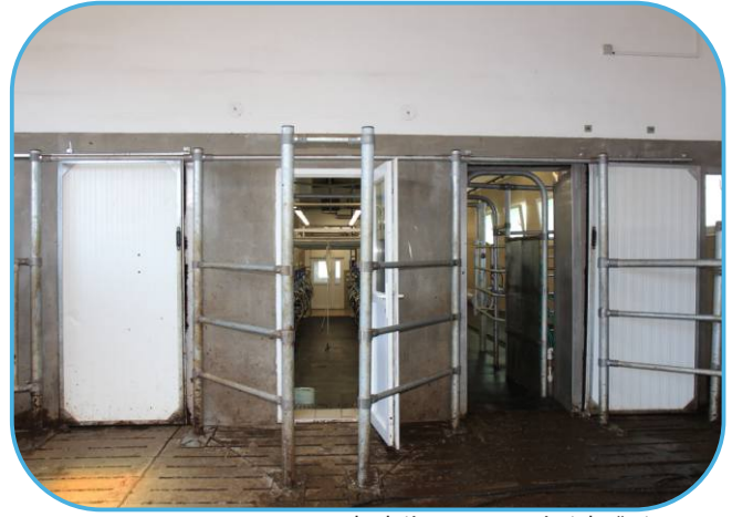
vstupy do dojírny s posuvnými dveřmi