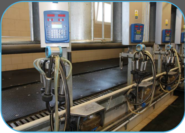
dojící stroje s polohovatelnými rameny