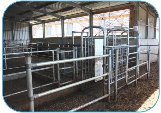
selekční branka výstupní uličce z dojírny