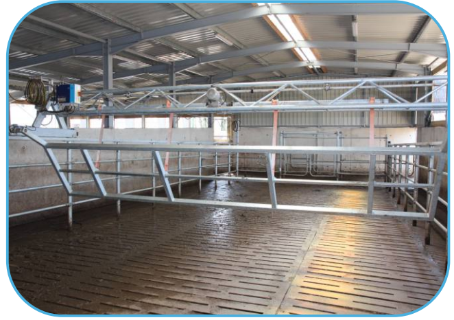
zarošťovaná čekárna s příhaněčem