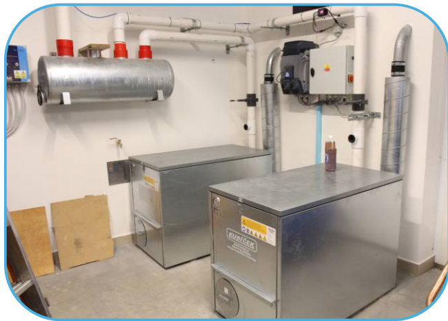
dmychadla s frekvenčním měničem