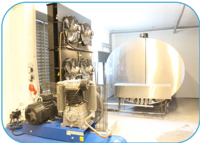
technické zázemí dojírny