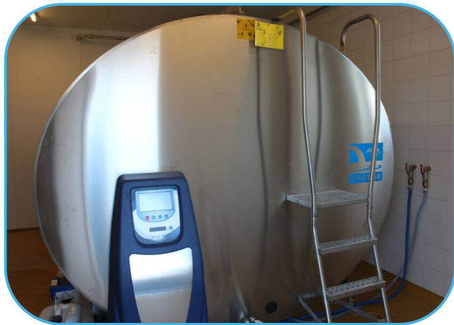
chladicí tank na mléko SERAP