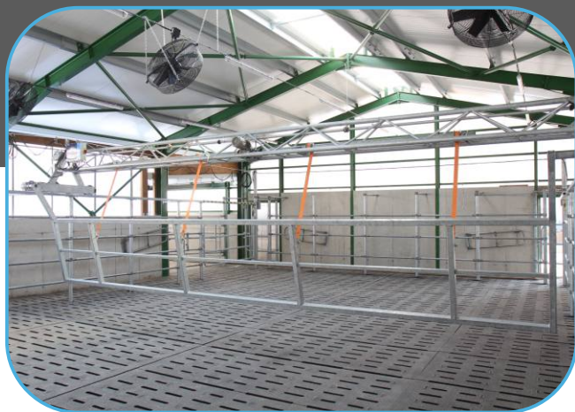
gumové roštové matrace v čekárně s přiháněčem dojnic