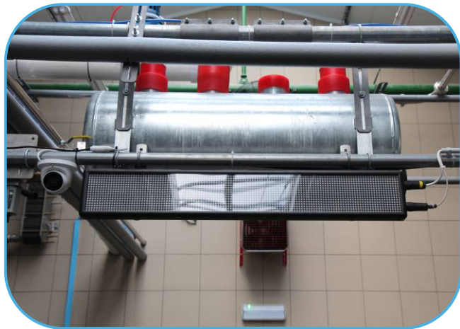
info panel na dojírnu