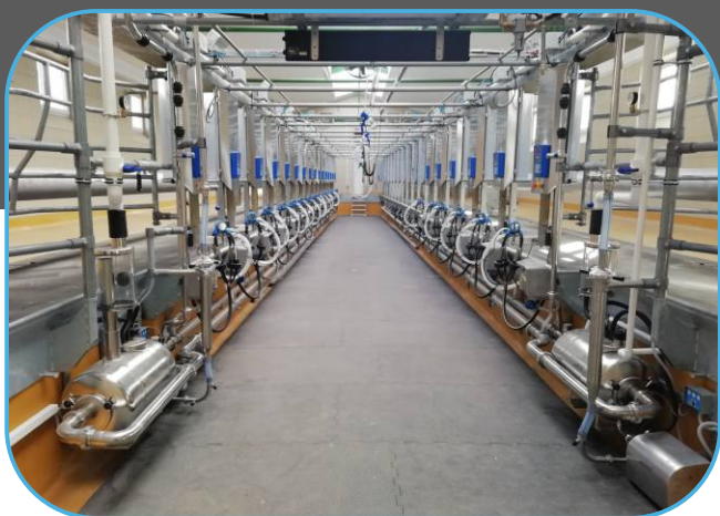
rybinová dojírna 2 x 16 stání