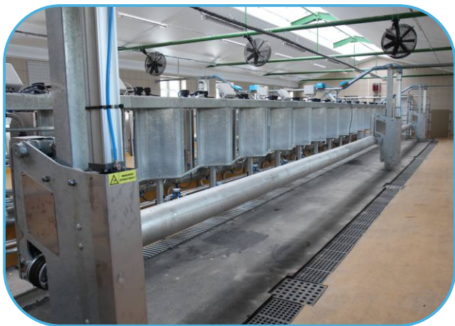
nová konstrukce rychlého odchodu dojnic