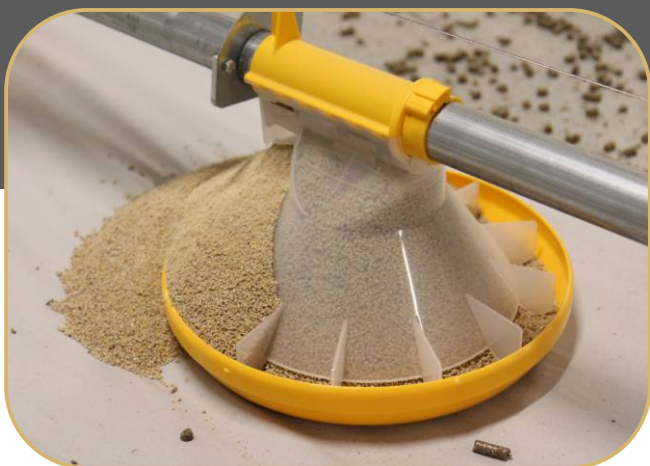
miskové krmítko KICK-OFF 160°