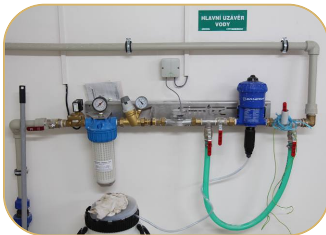
uzel s medikátorem pro systém napájení