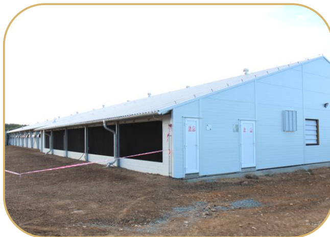
konec haly s chladičimi voštinami