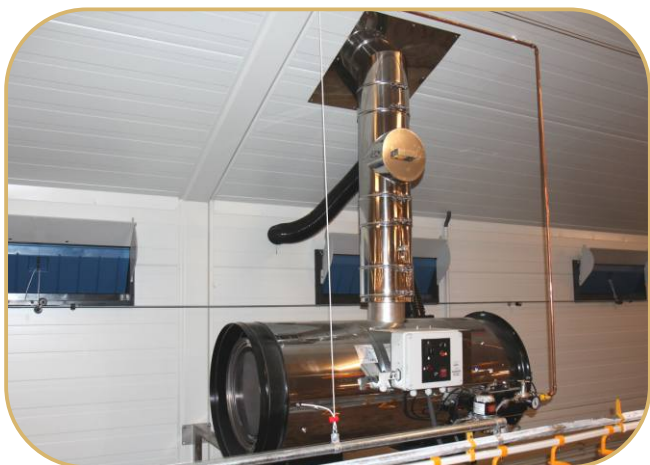
topidlo BH 50 s přívodem vzduchu a odvodem spalin