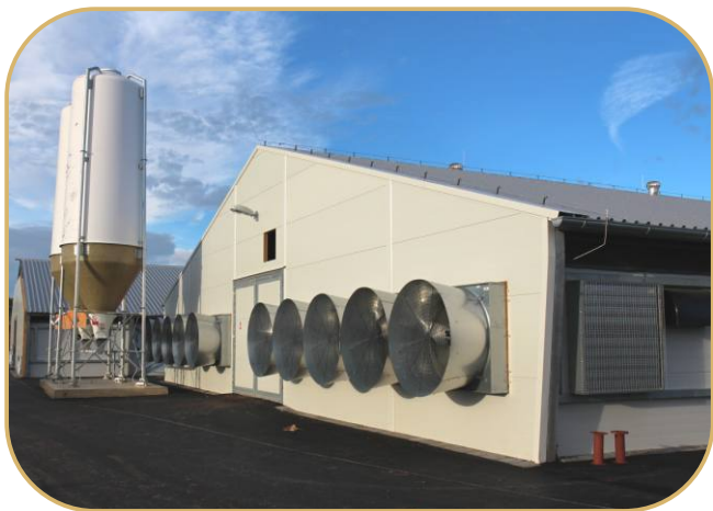
konec haly se štitovými ventilátory a zásobníky