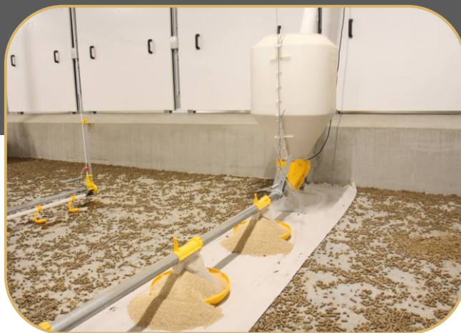
konec linie krmení s plastovou násypkou