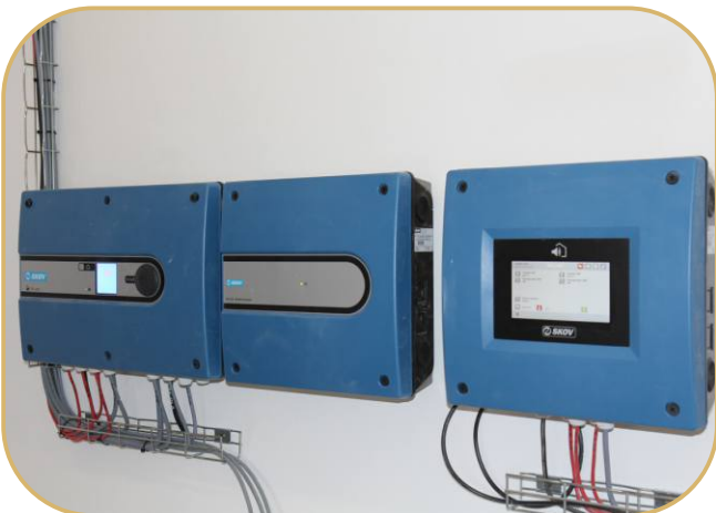
klimapočítač s nouzovým otevráním a alarm