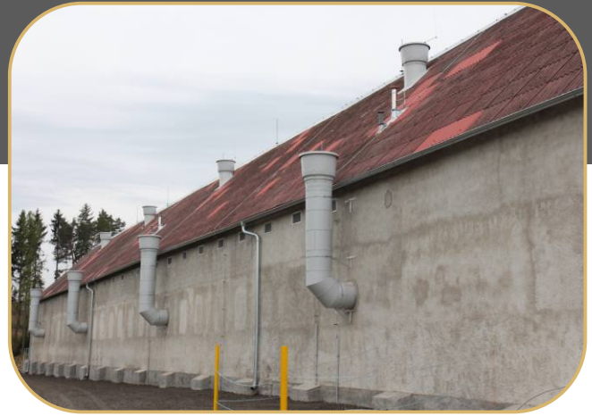
ventilační komíny 1. a 2. patra