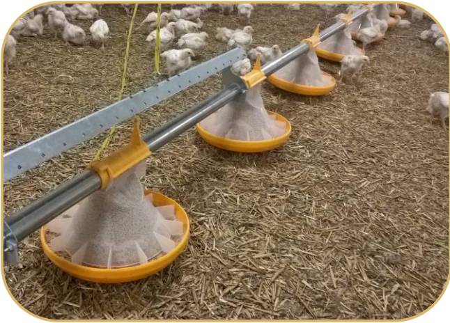
miskové krmítko KICK-OFF 160°