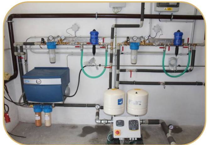
čerpadlo chlazení a medikační uzly