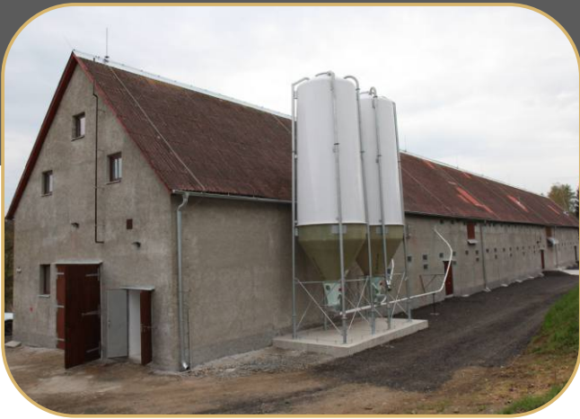
sklolaminátové zásobníky vedle budovy bývalé K120