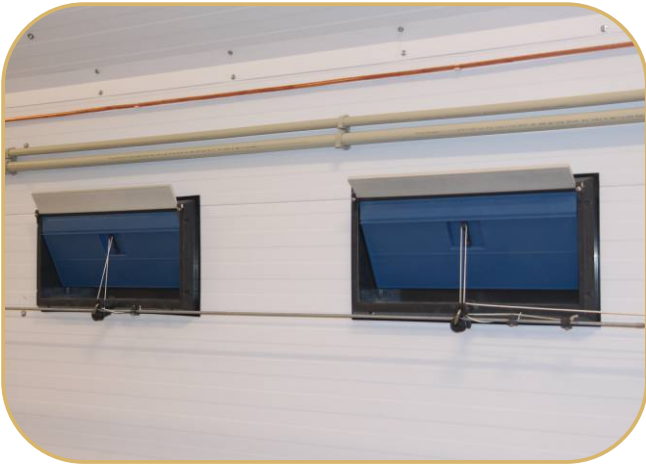
stěnové přívodní klapky