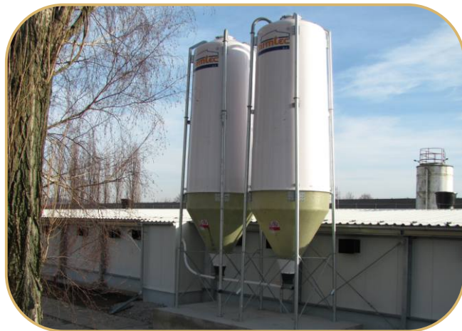
sklolaminátové zásobníky krmiva