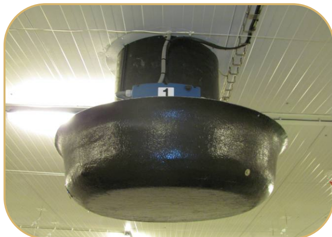
světelná past pro odtahový komín