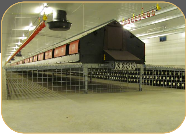
snášková hnízda s plastovými rošty