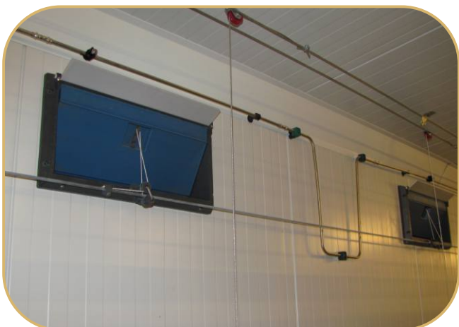
systém vysokotlakého chlazení umístěný nad klapkami