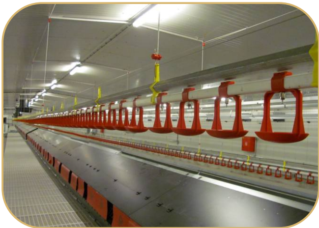
napájecí linie s nerezovými niplý