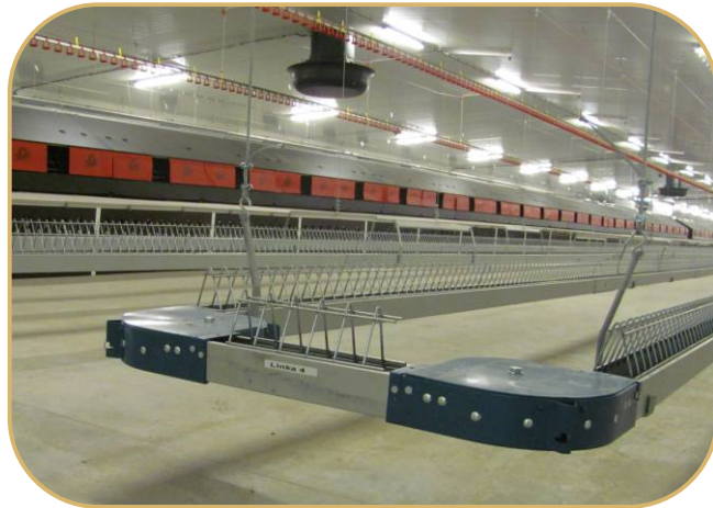
řetězové krmení pro slepice