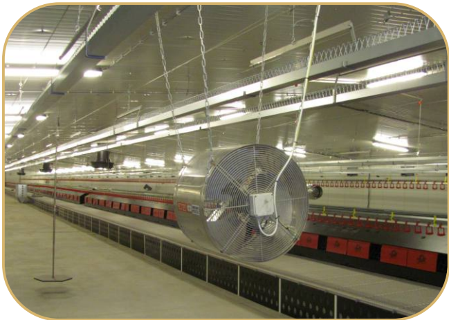
závěsná váha na drůbež (vlevo), podávaciventilátor