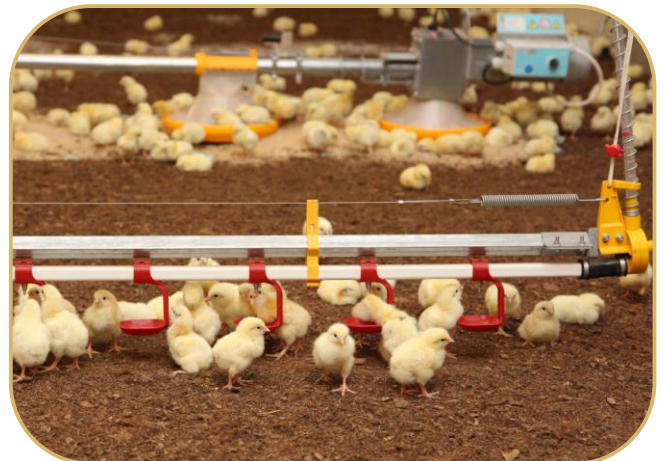
napajecí linie s celonerezovými niplý