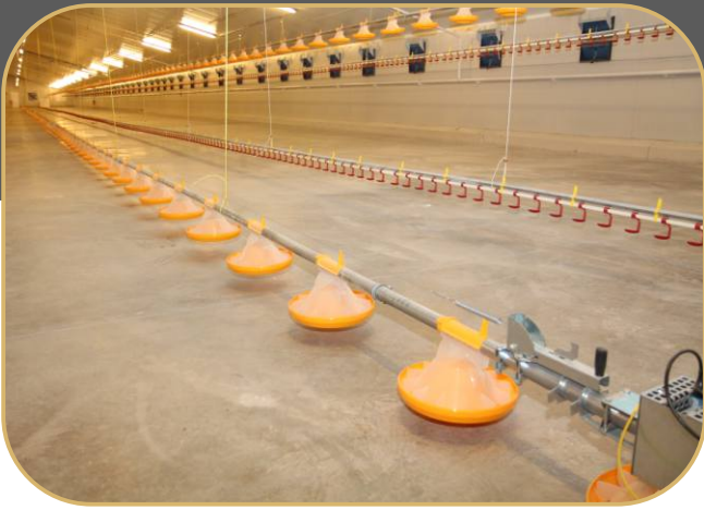
miskové krmítko KICK-OFF 160°