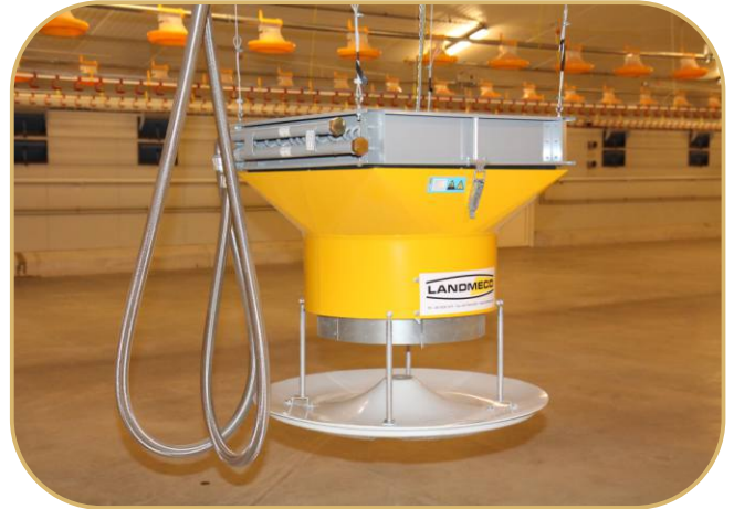
teplovodní topidlo CALORI-AIR