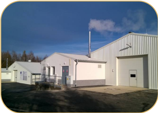
přípravna s kotelnou u každé haly