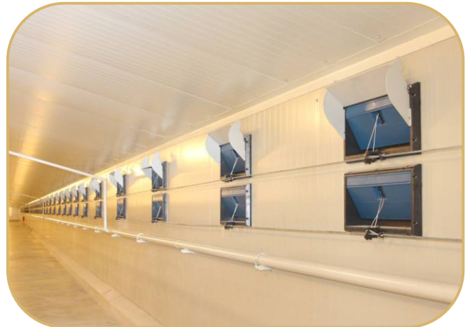
stěnové přívodní klapky