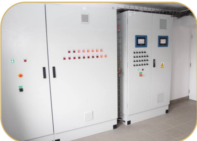
silový a řídicí rozvaděč s klima a produkčním počítačem