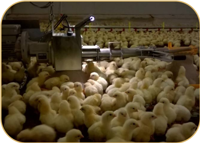
LED osvětlení kontrolního krmítka