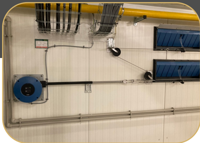
stěnové přívodní klapky