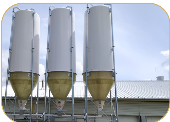
sklolaminátové zásobníky krmiv