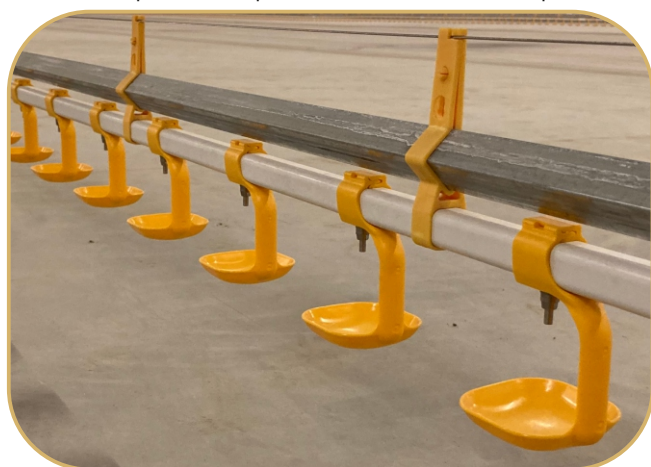
napajecí linie s celonerezovými niplý