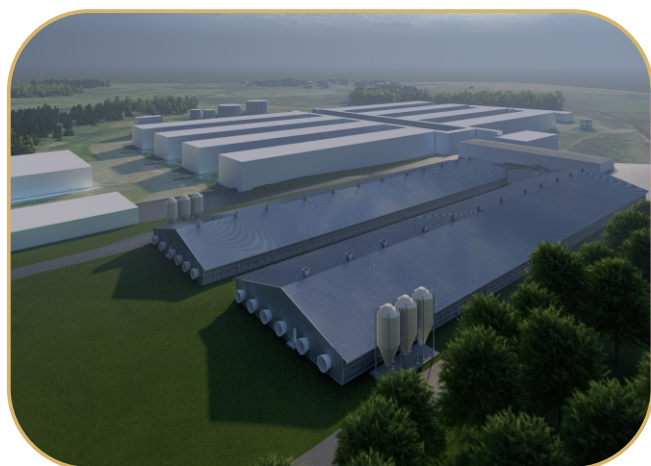
3D model farmy