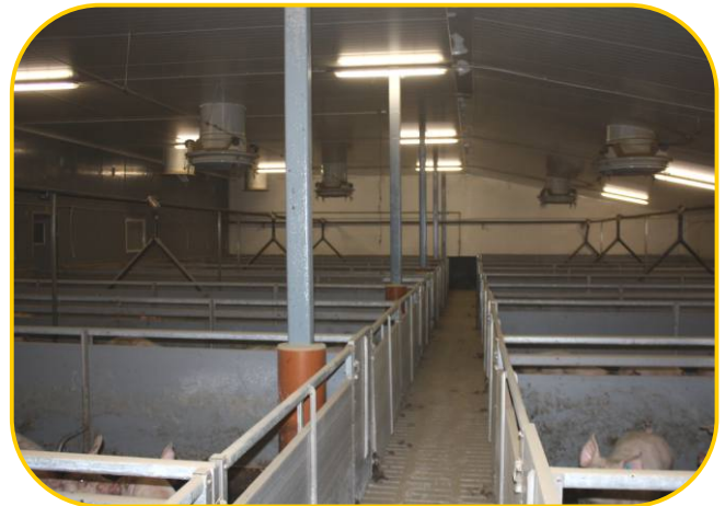
plastnerezové hrazení s polymerbetonovými koryty