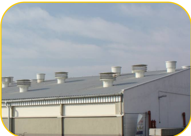
podtlaková ventilace s přívodními a odtahovými komíny