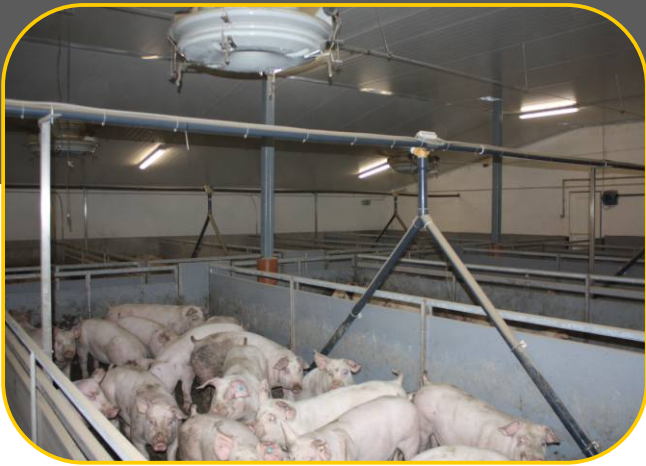
rozvod krmiva s dávkovacími ventily