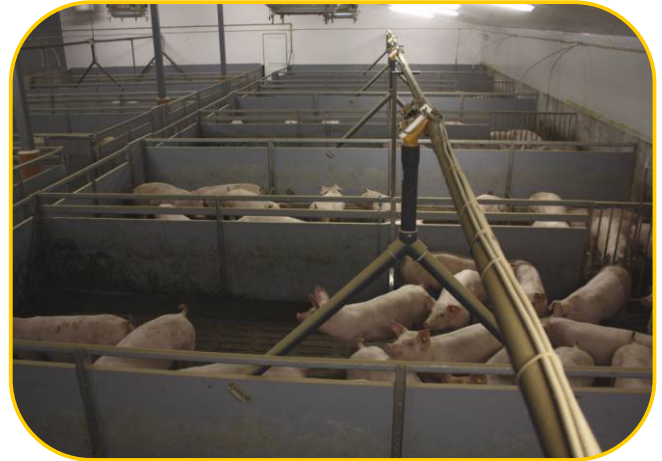
v jedné sekci je 20 kotců pro cca 18 prasat