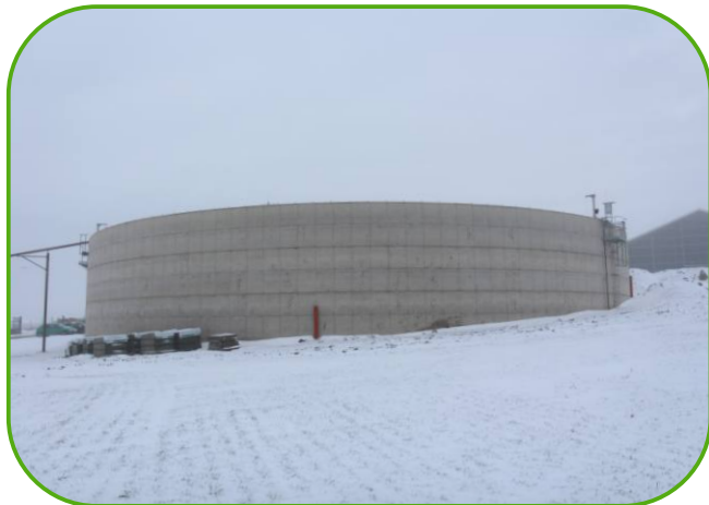
na stáj navazuje skladovací jímka s míchadly a čerpadly