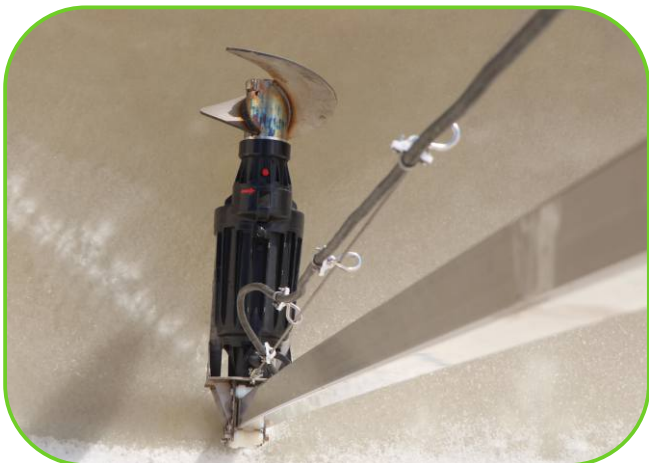
míchadlo kejdy s nerezovou vrtulí