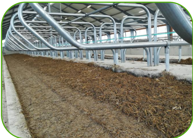
zastýlané ležací boxy s prsní opěrkou