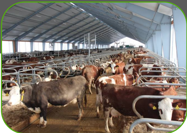
tři řady ležacích boxů na každé polovině stáje