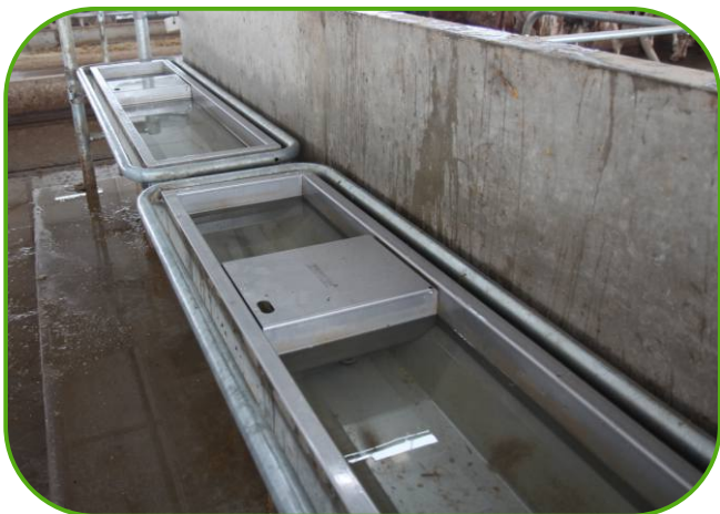
plovákové komory žlabů jsou přístupné bez použití nářadí