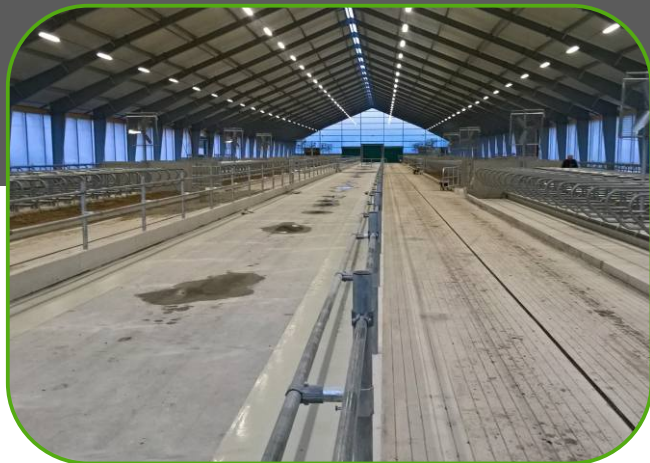
systém ASŘ ovládá LED osvětlení, ventilátory a boční plachty