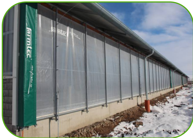
boční svinovací plachty