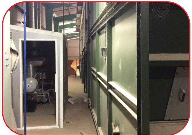
strojovna vedle sušárny