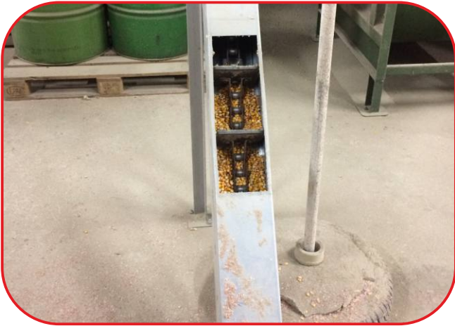
vstupní dopravník sušeného materiálu