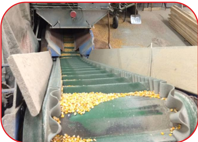
výstupní dopravník usušeného materiálu