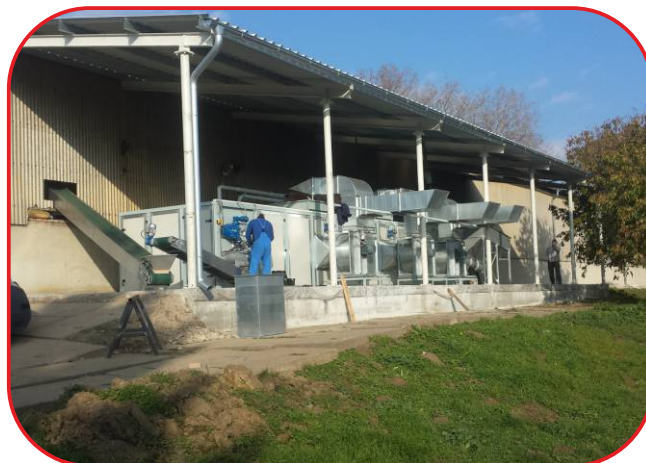
sušárna je umístěná venku pod přístřeškem