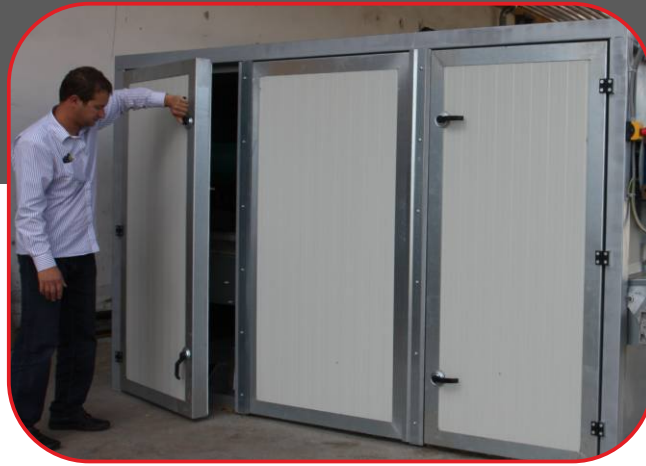
koncová část sušárny, veškeré panely na sušárně lze otvírat