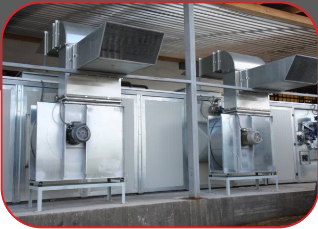
vzduchotechnická část - ventilátory