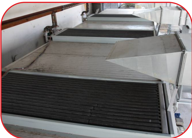
vstup čerstvého vzduchu do sušárny přes výměník