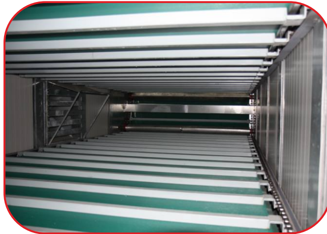
pohled mezi pásy