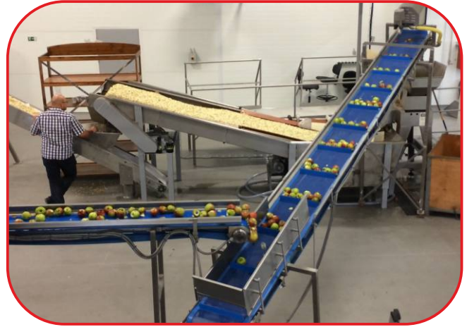
doprava do drtiče