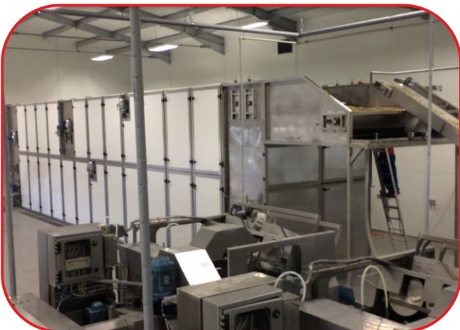
pásová sušárna vstup