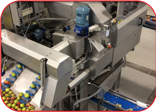
zařízení na separaci jádřinců