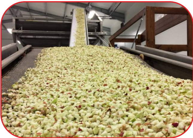
dopravník z drtiče do sušárny