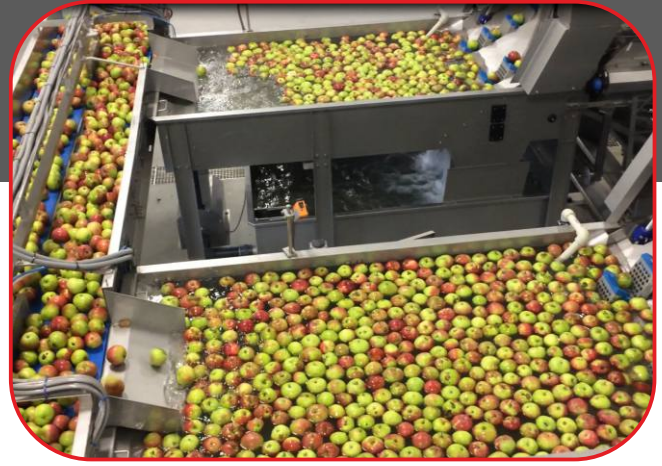
mytí ovoce na vstupu