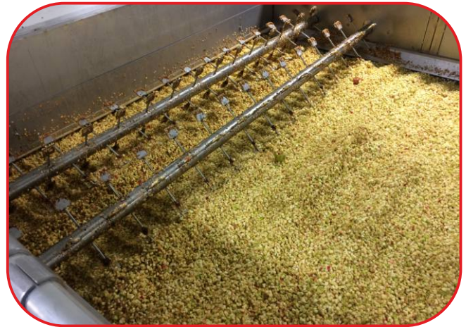
čechrače na vstupu do sušárny