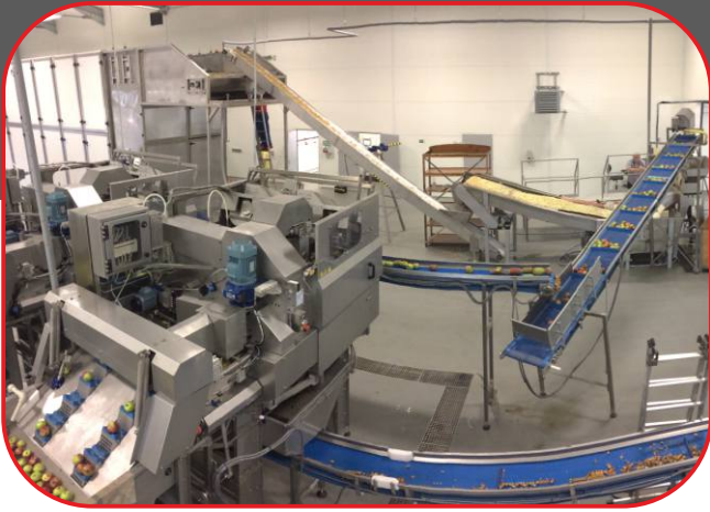
celkový pohled na linku