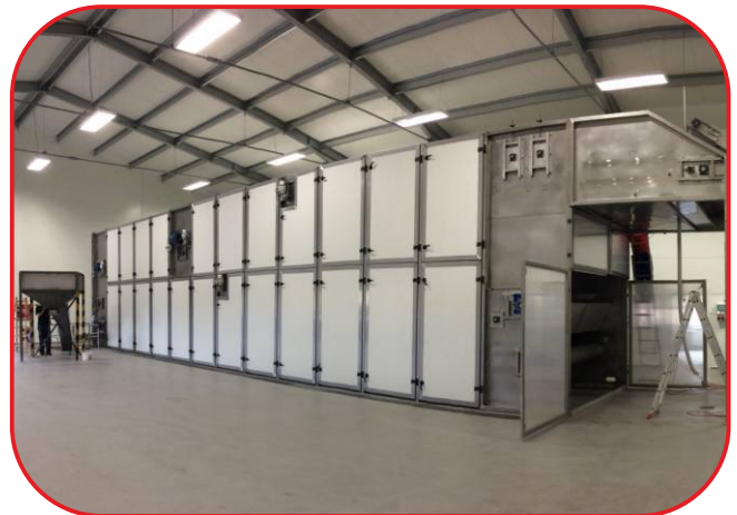
pásová sušárna celek