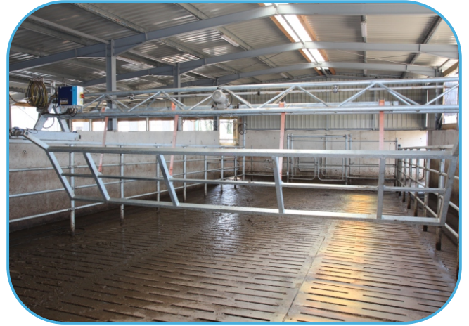
zarošťovaná čekárna s příhaněčem