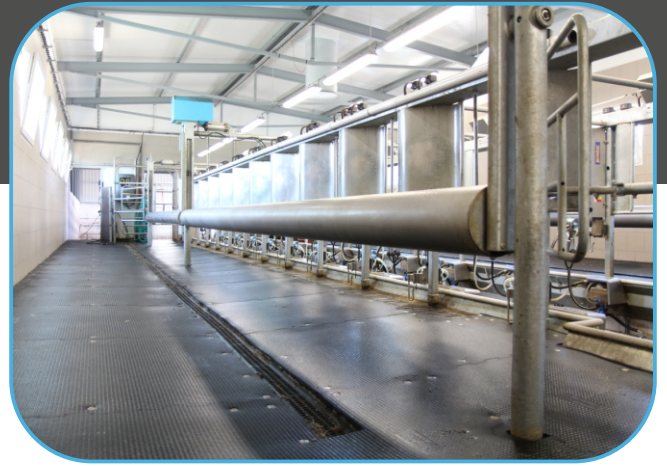
přítlak a rychlý odchod z dojírny