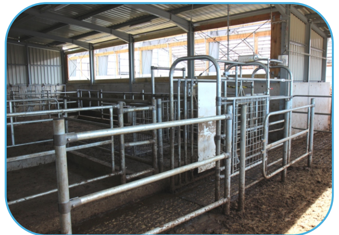
selekční branka výstupní uličce z dojírny