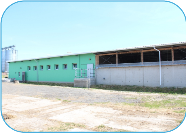
na dojírnu navazuje čekárna dojnic