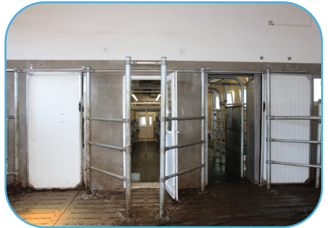
vstupy do dojírny s posuvnými dveřmi