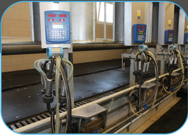
dojící stroje s polohovatelnými rameny