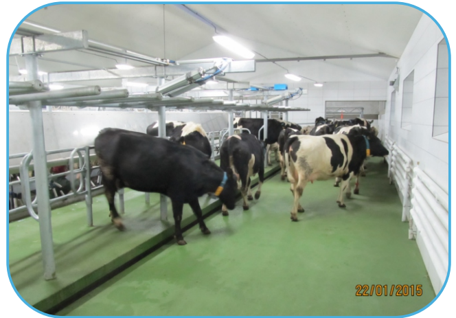
odchod dojnic z dojirny