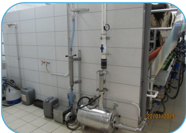
čerpadlo mléka, nerezový filtr, sběrná nádoba