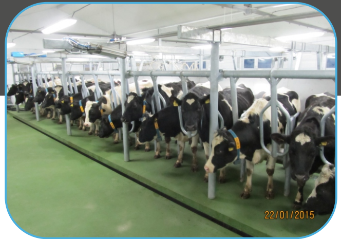
přítlak dojnic na dojárně