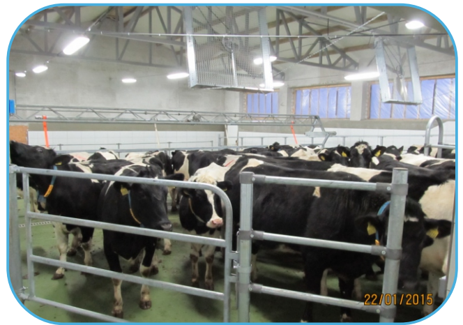
v čekárně jsou axiální ventilátory