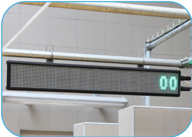
info panel je umístěný přímo na dojárně