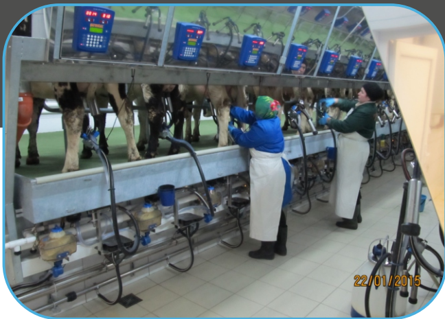
ovládací panely a měřiče nádoje