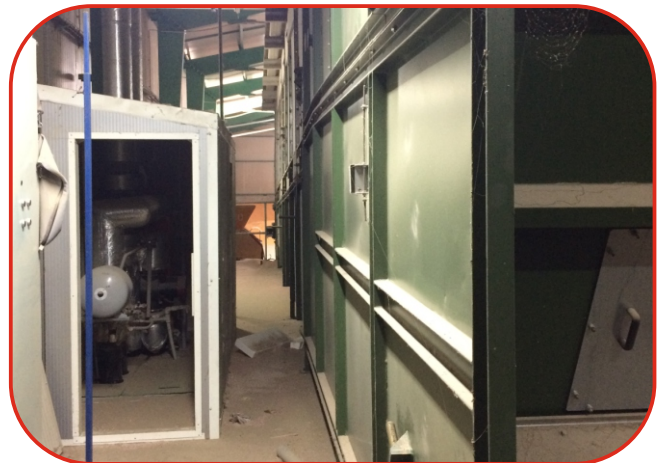
strojovna vedle sušárny