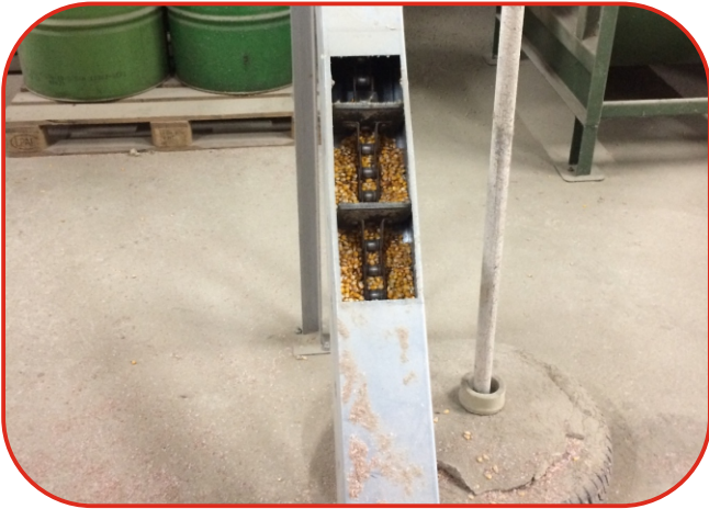
vstupní dopravník sušeného materiálu